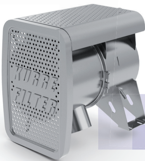
Dieselpartikelfilter - ON-ROAD / Ausführung für MERCEDES - Sattelschlepper / Pritsche