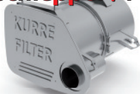
Dieselpartikelfilter - ON-ROAD / Ausführung für MAN - F2000 Sattelschlepper / Pritsche