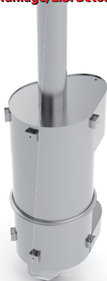
Dieselpartikelfilter - ON-ROAD / Ausführung für MERCEDES- Sonderfahrzeug mit hinterm Fahrer- haus stehender Auspuffanlage, z.B. Betonmischer