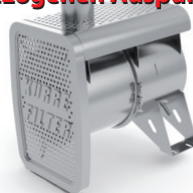
Dieselpartikelfilter - ON-ROAD / Ausführung für MERCEDES - Sonderfahrzeug mit hinterm Fahrerhaus nach oben gezogenen Auspuffrohr