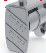
Dieselpartikelfilter - ON-ROAD / Ausführung für MAN - Sonderfahrzeug mit hinterm Fahrerhaus nach oben gezogenen Auspuffrohr