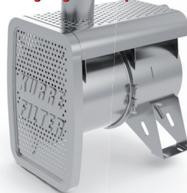
Dieselpartikelfilter - ON-ROAD / Ausführung für MERCEDES - Sonderfahrzeug mit hinterm Fahrerhaus nach oben gezogenen Auspuffrohr