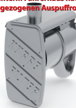
Dieselpartikelfilter - ON-ROAD / Ausführung für MAN - Sonderfahrzeug mit hinterm Fahrerhaus nach oben gezogenen Auspuffrohr