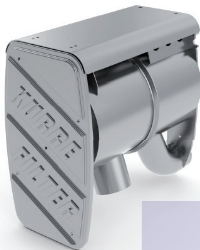
Dieselpartikelfilter - ON-ROAD / Ausführung für MAN Sattelschlepper / Pritsche