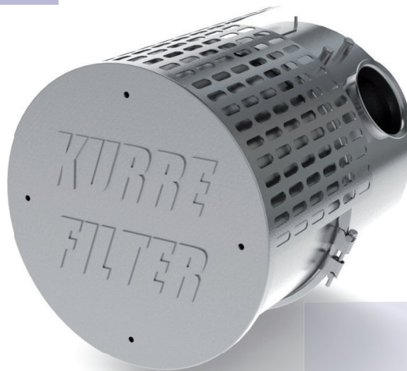
Dieselpartikelfilter - ON-ROAD / Ausführung für Volvo - Sattelschlepper / Pritsche

Zusammen mit BASF konnten wir in einer intensiven Entwicklungsphase unsere Dieselpartikelfilter stetig verbessern und sind stolz mit dem Kurre-Filter einen Standard in der Abgasnachbehandlung geschaffen zu haben, der hohe Maßstäbe erfüllt.