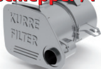
Dieselpartikelfilter - ON-ROAD / Ausführung für MAN - F2000 Sattelschlepper / Pritsche