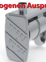
Dieselpartikelfilter - ON-ROAD / Ausführung für MAN - Sonderfahrzeug mit hinterm Fahrerhaus nach oben gezogenen Auspuffrohr