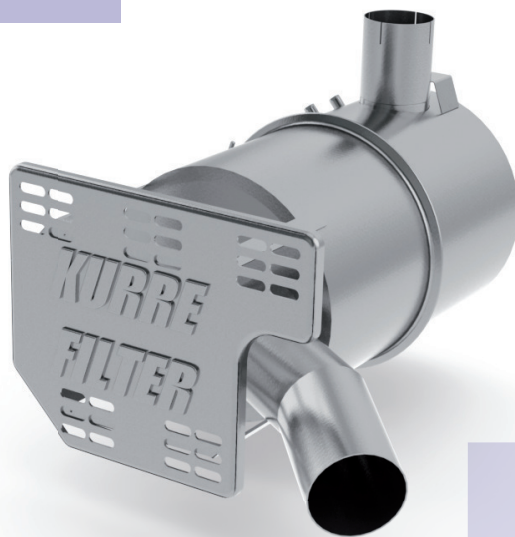
Dieselpartikelfilter - ON-ROAD / Ausführung für Iveco - Sattelschlepper / Pritsche

Zusammen mit BASF konnten wir in einer intensiven Entwicklungsphase unsere Dieselpartikelfilter stetig verbessern und sind stolz mit dem Kurre-Filter einen Standard in der Abgasnachbehandlung geschaffen zu haben, der hohe Maßstäbe erfüllt.