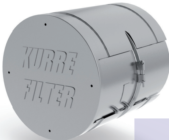
Dieselpartikelfilter - ON-ROAD / Ausführung für DAF - Sattelschlepper / Pritsche

Zusammen mit BASF konnten wir in einer intensiven Entwicklungsphase unsere Dieselpartikelfilter stetig verbessern und sind stolz mit dem Kurre-Filter einen Standard in der Abgasnachbehandlung geschaffen zu haben, der hohe Maßstäbe erfüllt.