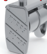
Dieselpartikelfilter - ON-ROAD / Ausführung für MAN - Sonderfahrzeug mit hinterm Fahrerhaus nach oben gezogenen Auspuffrohr